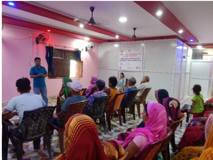
वै.रो.बाट फर्केका व्यक्तिहरु तथा परिवारहरुलाई पुनः एकीकरण अभिमुखिकरण सत्र, पिपरा-०४