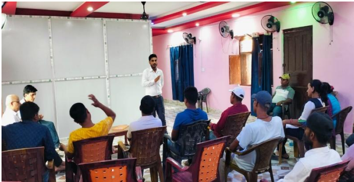
सरकारवालाहरुसंग सिफारिश पद्धतिका लागि समन्वय बैठक (सामाजिक न्याय, मानसिक स्वास्थ्य र उपचार)