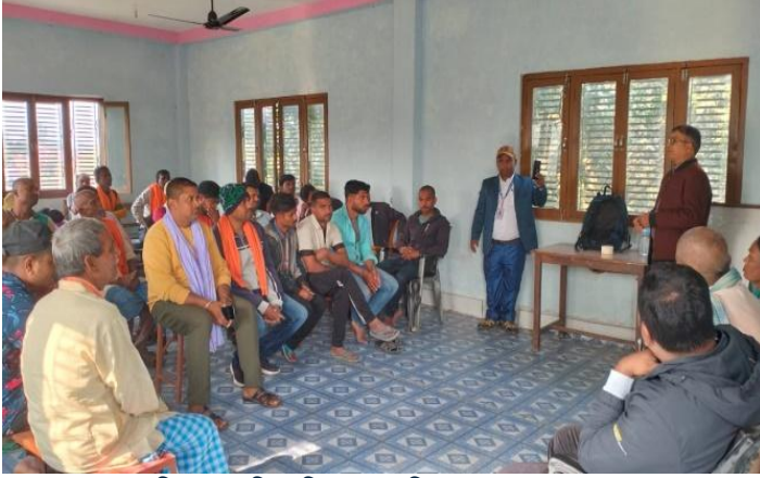
सामाजिक अभिमुखिकरण पिपरा-०१