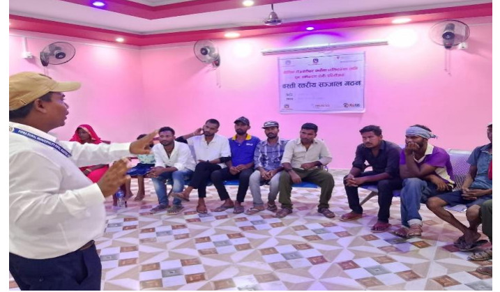
वै.रो. बाट फर्केका व्यक्तिहरुको वस्ती स्तरीय संजाल गठन,पिपरा-४