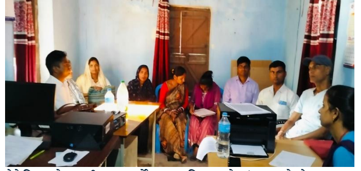
वैदेशिक रोजगारी बाट फर्केका व्यक्तिहरुको संजालको बैठक