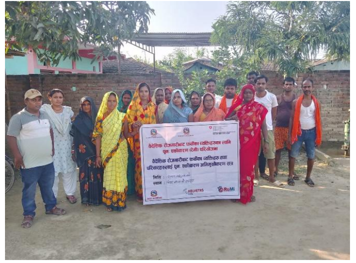
वै.रो.बाट फर्केका व्यक्तिहरु तथा परिवारहरुलाई पुनः एकीकरण अभिमुखिकरण सत्र, पिपरा-०१