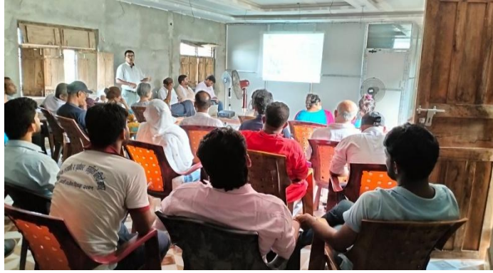
शाखा प्रमुखहरु संग समन्वय बैठक