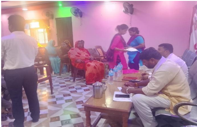
बार्षिक कार्यक्रम समिक्षा योजना तर्जुमा गोष्ठी