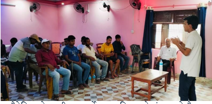
वैदेशिक रोजगारी बाट फर्केका व्यक्तिहरुको संजालको बैठक