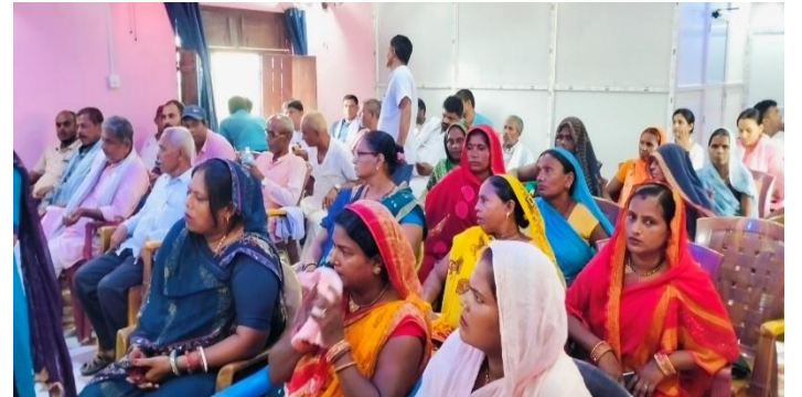
स्थानीय पदाधिकारीहरु संग परियोजना सम्बन्धि अभिमुखीकरण कार्यक्रम