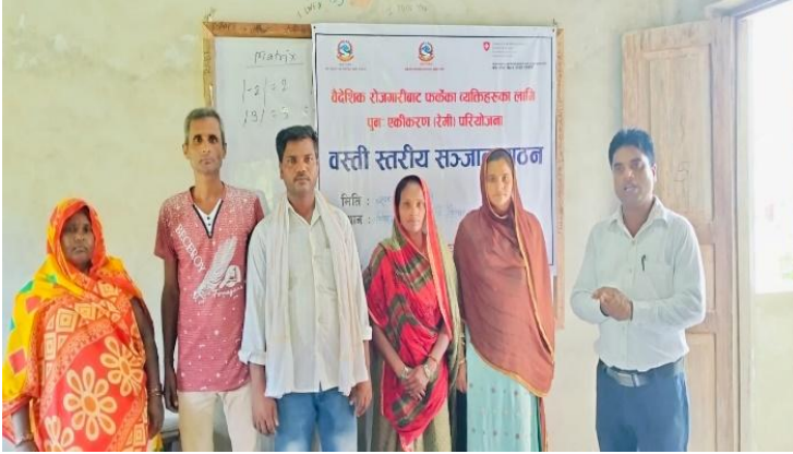
वै.रो.बाट फर्केका व्यक्तिहरुको वस्ती स्तरीय संजाल गठन,पिपरा-१