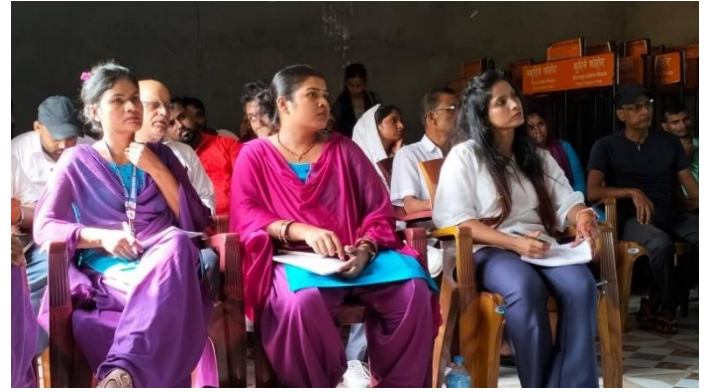
शाखा प्रमुखहरु संग समन्वय बैठक