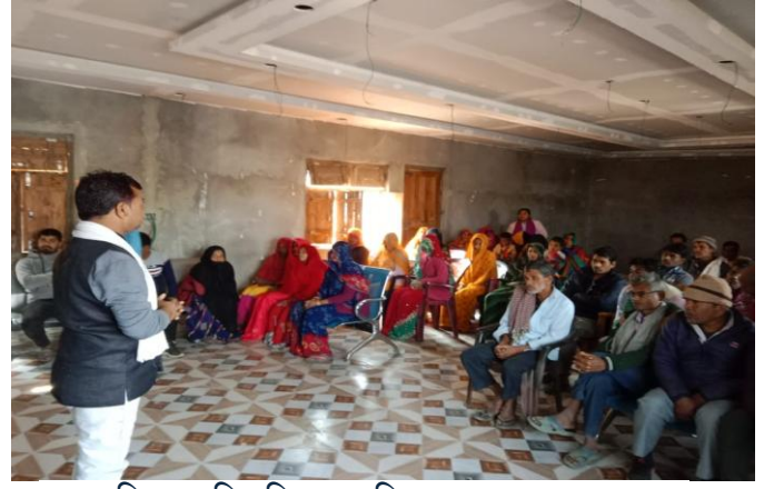
सामाजिक अभिमुखिकरण पिपरा-०४